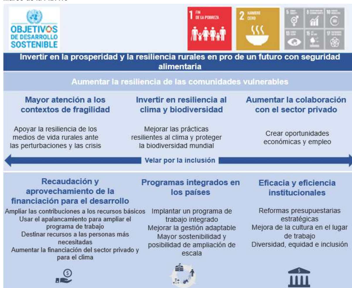
Gráfico 1 Marco de la FIDA13