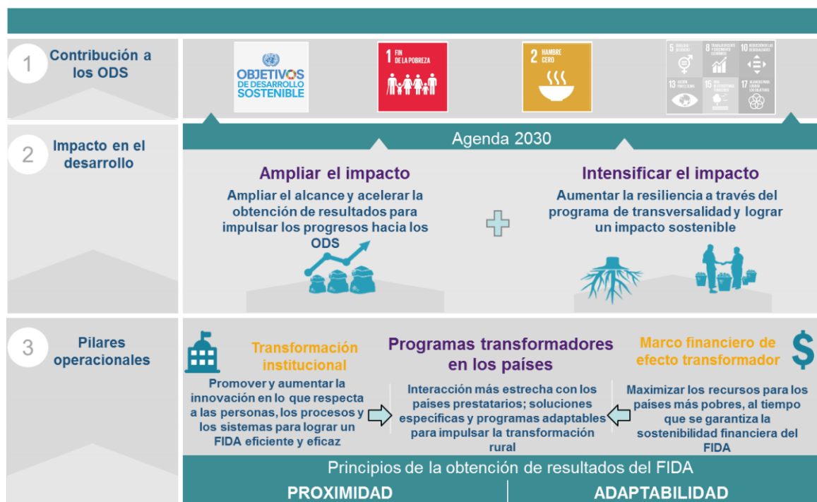
Gráfico 2 Teoría del cambio para la FIDA12

basarán en la transformación de la propia institución (a través de las personas, los procesos y los sistemas) y su estructura financiera (asegurando la sostenibilidad financiera al tiempo que se maximizan los recursos para los países y las personas más pobres).