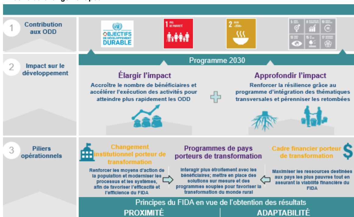
Figure 2 Théorie du changement pour FIDA12