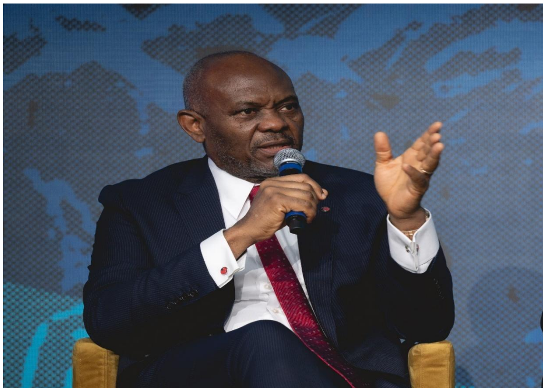
Sr. Tony Elumelu, presidente del grupo de Heirs Holding y United Bank for Africa y fundador de la Tony Elumelu Foundation