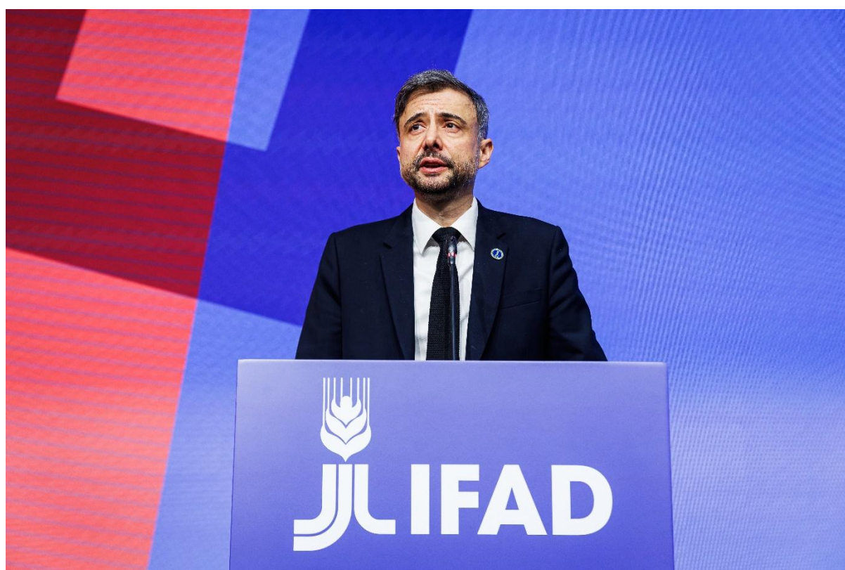
Sr. Álvaro Lario Presidente del FIDA