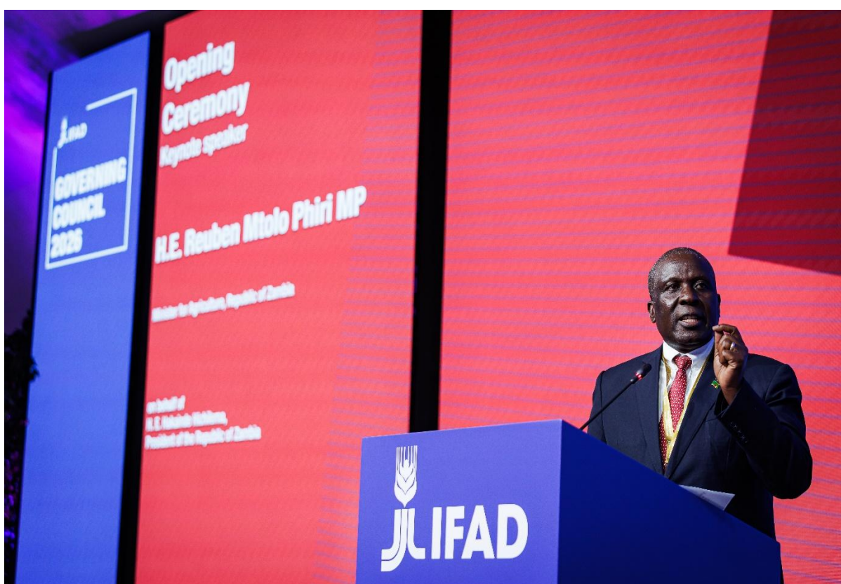
Excmo. Sr. Reuben Mtolo Phiri, Miembro del Parlamento Ministro de Agricultura de la República de Zambia, en representación del Excmo. Sr. Hakainde Hichilema, Presidente de la República de Zambia