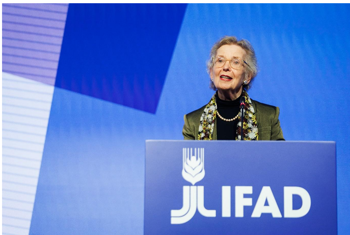
Excma. Sra. Mary Robinson Cofundadora de Project Dandelion, ex-Presidenta de Irlanda y ex Alta Comisionada de las Naciones Unidas para los Derechos Humanos