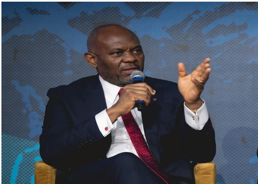
M. Tony Elumelu, Président du groupe Heirs Holding et de la United Bank for Africa, et fondateur de la Fondation Tony Elumelu