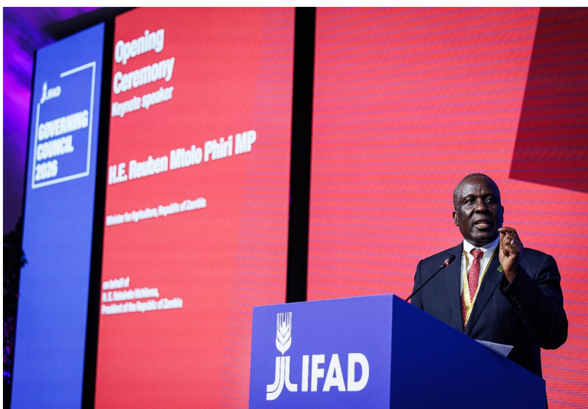
Son Excellence Reuben Mtolo Phiri, Ministre de l'agriculture de la République de Zambie, au nom de Son Excellence M. Hakainde Hichilema, Président de la République de Zambie