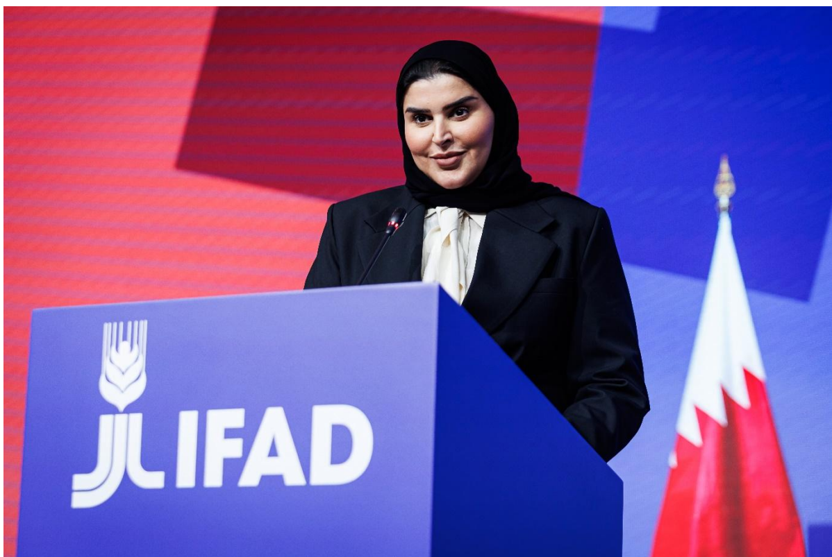
Son Excellence Maryam bint Ali bin Nasser Al Misnad Ministre d'État à la coopération internationale, Ministère des affaires étrangères de l'État du Qatar, au nom de l'État du Qatar