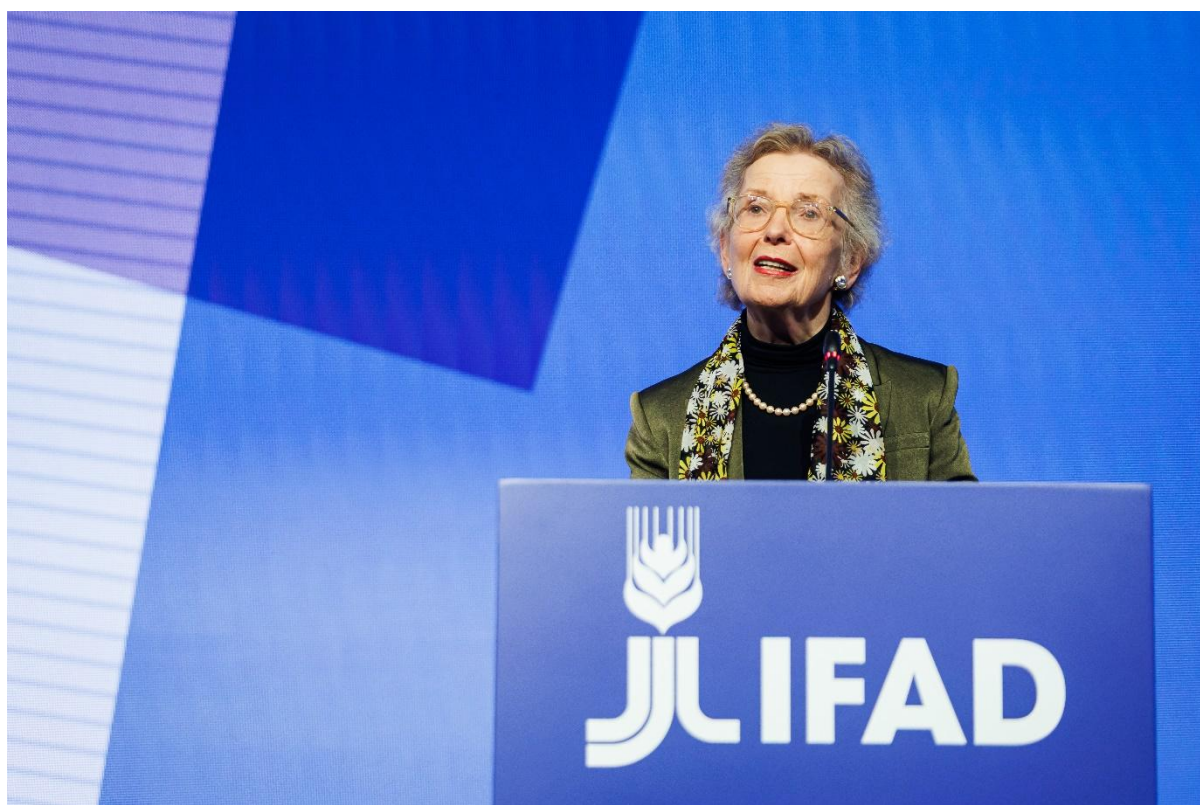
Son Excellence Mary Robinson Cofondatrice de Project Dandelion, ancienne Présidente de l'Irlande et ancienne Haute-Commissaire des Nations Unies aux droits de l'homme