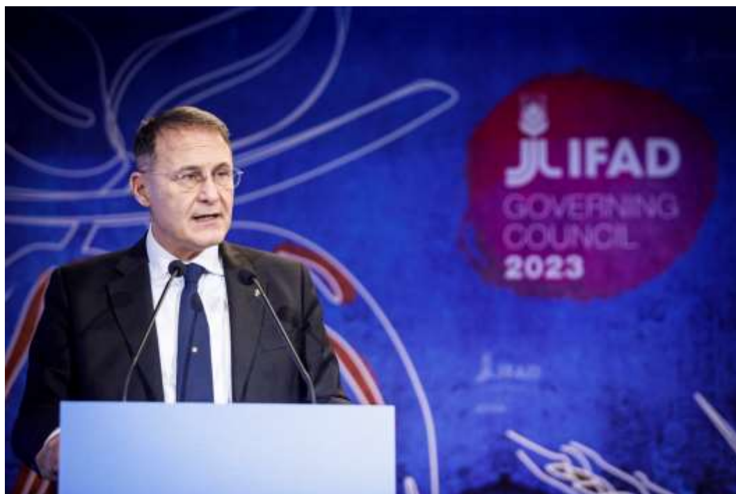
Honorable Sr. Edmondo Cirielli, Viceministro de Relaciones Exteriores y Cooperación Internacional de la República Italiana