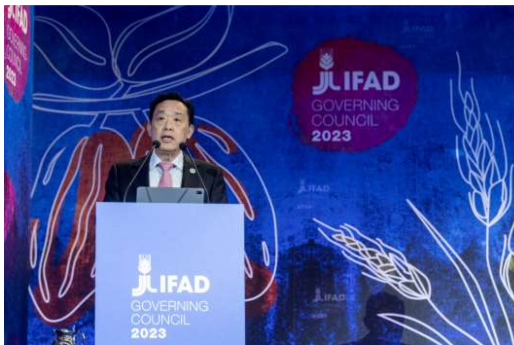
Sr. QU Dongyu, Director General de la Organización de las Naciones Unidas para la Alimentación y la Agricultura