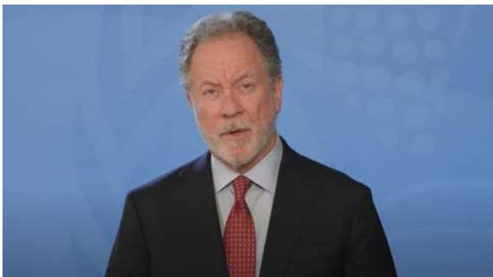
Sr. David Beasley, Director Ejecutivo del Programa Mundial de Alimentos