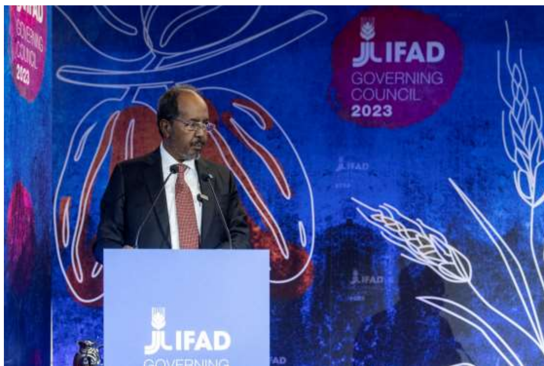
Excmo. Sr. Hassan Sheikh Mohamud, Presidente de la República Federal de Somalia