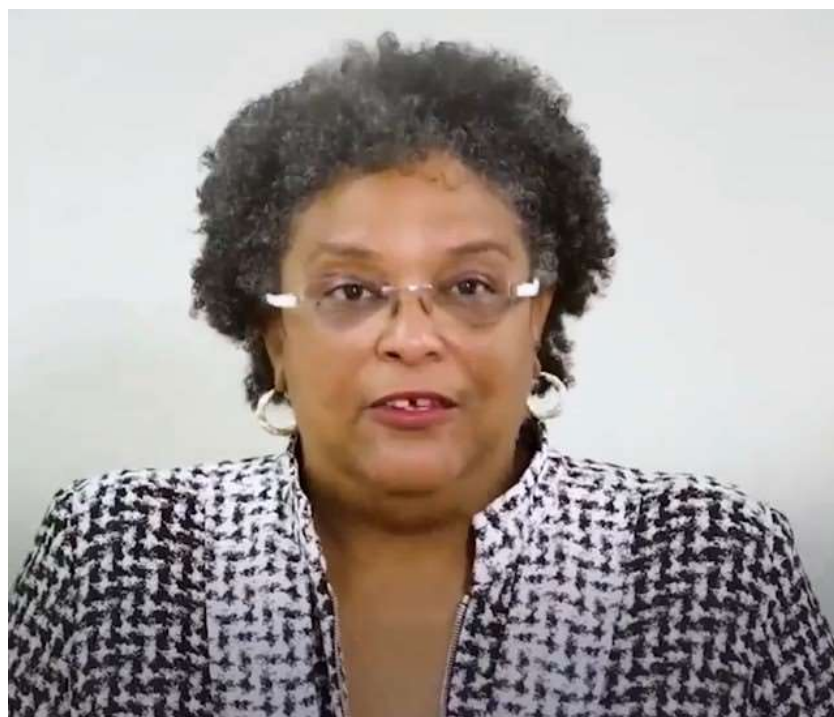
Excmma. Sra. Mia Amor Mottley, Primera Ministra de Barbados