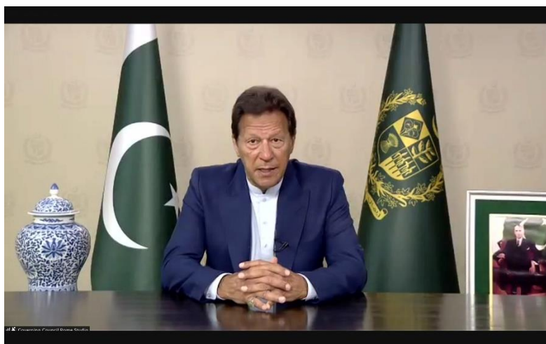
Excmo. Sr. Imran Khan, Primer Ministro de la República Islámica del Pakistán