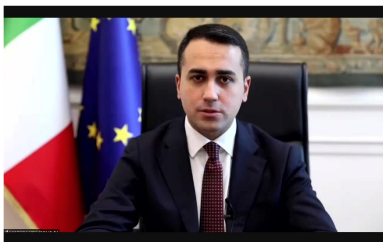
Excmo. Sr. Luigi Di Maio, Ministro de Relaciones Exteriores y Cooperación Internacional de la República Italiana