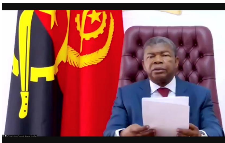
Excmo. Sr. João Lourenço, Presidente de la República de Angola