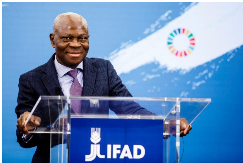
Sr. Gilbert Houngbo, Presidente del IFAD