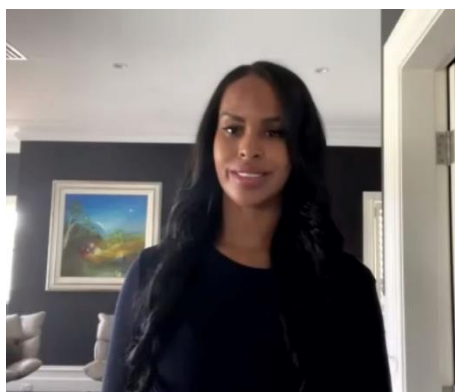
Sra. Sabrina Elba, Embajadora de Buena Voluntad del FIDA