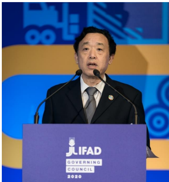
Señor QU Dongyu Director General de la Organización de las Naciones Unidas para la Alimentación y la Agricultura