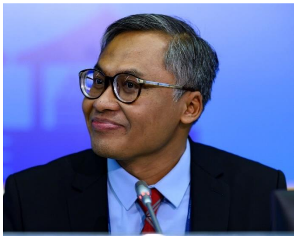
Señor Suminto Presidente del Consejo de Gobernadores Gobernador de la República de Indonesia