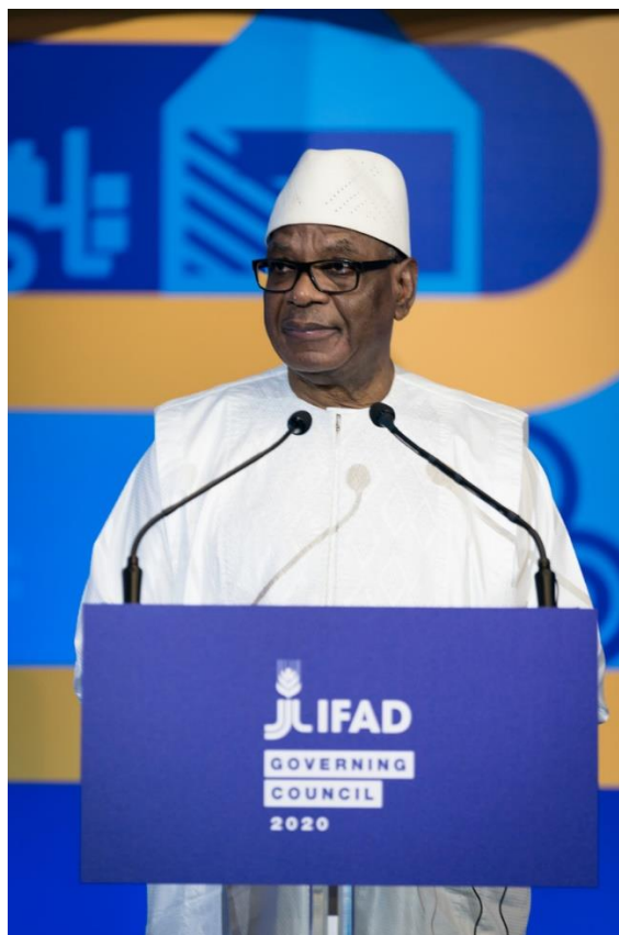
Excelentísimo Señor Ibrahim Boubacar Keita Presidente de la República de Malí