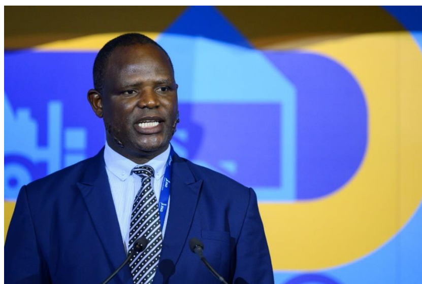
Excelentísimo Señor Japhet Hasunga, Ministro de Agricultura, quien asistió a la ceremonia inaugural en nombre del Excelentísimo Doctor John Pombe Magufuli, Presidente de la República Unida de Tanzania