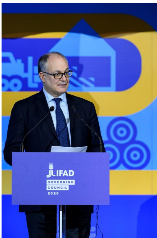
Excelentísimo Señor Roberto Gualtieri Ministro de Economía y Finanzas de la República Italiana