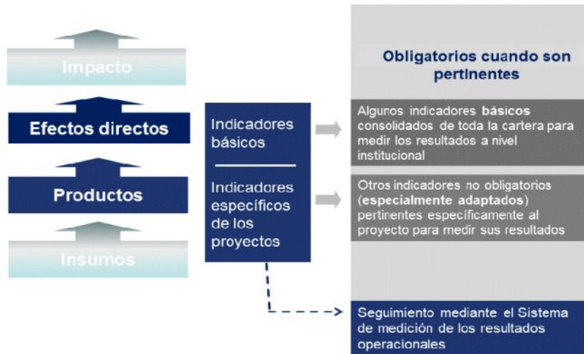
Figura 1 Indicadores básicos dentro de la cadena de resultados