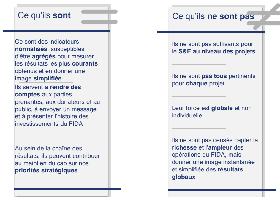
Figure 2 Portée des indicateurs de base