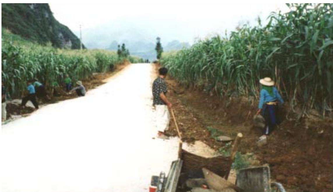
Proyecto de Conservación y Desarrollo de Recursos Agrícolas en la Provincia de Quang Binh Rehabilitación de un camino rural

10. Actividades de extensión agraria. El Proyecto de Ordenación de Recursos con la Participación de los Beneficiarios en la Provincia de Tuyen Quang fue el primer proyecto de alcance provincial en el que se utilizó la evaluación rural participativa (ERP) para determinar el contenido de las actividades de extensión en cada comuna. El sistema se aplicó también posteriormente a los proyectos de Quang Binh, Ha Giang y Ha Tinh. Sin embargo, anteriormente la mayor parte de las actividades de extensión consistían en programas de “transferencia de tecnología” dirigidos desde arriba y apenas se destinaban fondos a la investigación adaptativa.