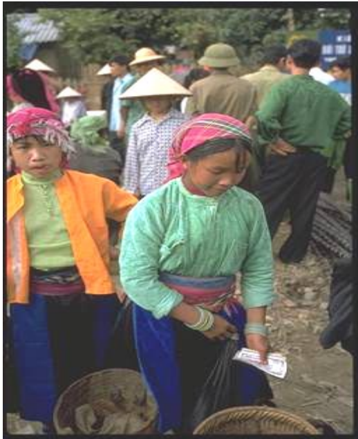
Proyecto de Desarrollo de Ha Giang en favor de las Minorías Étnicas Campeñinos de la minoría hmong en el mercado de Yen Minh. Las minorías étnicas acuden desde distintas partes del distrito para vender, comprar, comer y relacionarse

20. Participación de los beneficiarios. Si bien es cierto que durante la evaluación ex ante se consulta a diferentes grupos que viven en situación de pobreza, lo cierto es que la participación activa de los pobres en la determinación de las necesidades y la configuración del diseño del proyecto sigue siendo escasa. Esto es particularmente cierto en el caso de los componentes de riego y construcción de caminos, que en muchos casos están predeterminados. La principal contribución del FIDA ha consistido en el fomento de la ERP como instrumento de planificación operativa, para la cual la ERP de varios componentes que se llevó a cabo en Tuyen Quang resultó más eficaz que el sistema de ERP sectoriales que se aplicó en otros proyectos. Con respecto a la evaluación, en Tuyen Quang se ha institucionalizado la evaluación participativa integrada, con el seguimiento de la situación de pobreza y los planes de trabajo a nivel de aldea.