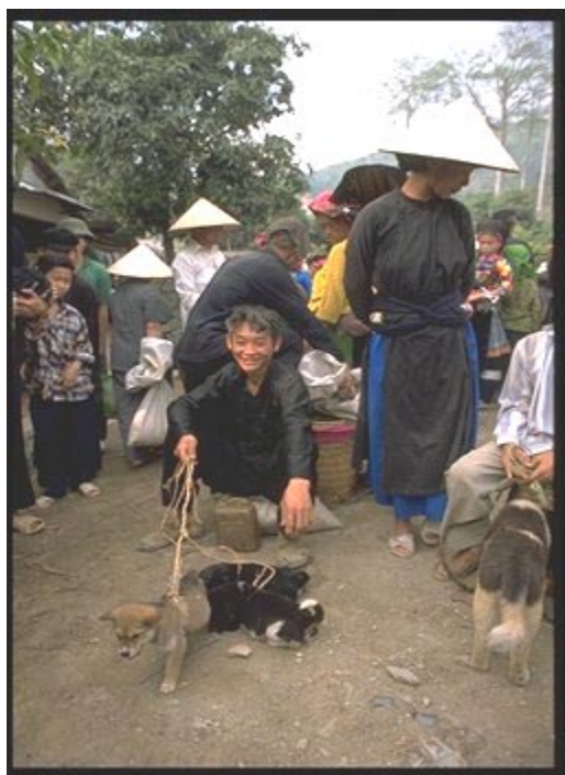
Proyecto de Desarrollo de Ha Giang en favor de las Minorías Étnicas Campesinos de la minoría hmong en el mercado de Yen Minh

46. Las conclusiones del EEPP confirman en términos generales que la estrategia del FIDA en Viet Nam continúa siendo válida, como se indicó en el COSOP de diciembre de 1996, pues hacen un claro hincapié en la asistencia a las comunas más pobres y el fomento de los procesos participativos. La orientación prioritaria hacia proyectos de desarrollo integrado dirigidos a una zona geográfica específica sigue siendo la apropiada. Aún así, cinco cuestiones normativas fundamentales requieren el examen conjunto del FIDA y el Gobierno, a saber: