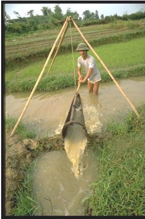
Proyecto de Ordenación de Recursos con la Participación de los Beneficiarios en la Provincia de Tuyen Quang Campesino trabajando en un canal de riego.

mediante actividades de capacitación y demostraciones en materia de prevención y tratamiento. En cuanto al impacto económico, sólo las familias más acomodadas poseen el capital y la mano de obra necesarios para la cría del camarón. En cambio, la piscicultura ofrece oportunidades y beneficios a todas las familias campesinas y les permite complementar sus actividades agrícolas tradicionales.