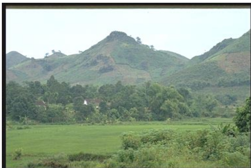
Proyecto de Ordenación de Recursos con la Participación de los Beneficiarios en la Provincia de Tuyen Quang Vista de una ladera repoblada, con arrozales en primer plano

13. Silvicultura. La finalidad del componente de silvicultura del Proyecto de Desarrollo de Ha Giang en favor de las Minorías Étnicas es apoyar los programas forestales que se están aplicando en cuencas hidrográficas fundamentales, principalmente adoptando modelos participativos de protección y suscribiendo contratos de protección forestal para 20 000 ha de bosques de gran importancia. Las principales actividades que se han llevado a cabo hasta la fecha son la compra de vehículos y equipo, la capacitación del personal y la preparación de un estudio del impacto ambiental. Se han suscrito contratos de protección para 11 000 ha de bosques y se han plantado 200 ha de nuevos bosques, siendo esta última una actividad que se añadió en 1999. En el marco del componente de fijación de dunas del Proyecto de Conservación y Desarrollo de Recursos Agrícolas en la Provincia de Quang Binh, se han plantado 2 700 ha de casuarina en 12 comunas del sur, en la zona de dunas, donde los agricultores se encargaron de todas las operaciones de plantación y mantenimiento. Alrededor del 70% de los campesinos locales, en su mayoría mujeres, se beneficiaron de las oportunidades de empleo. Los propios campesinos están produciendo plantones y en cada comuna se ha establecido una junta de autogestión para organizar las actividades de mantenimiento y protección.