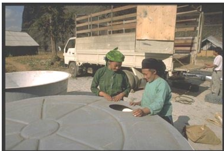
Proyecto de Desarrollo de Ha Giang en favor de las Minorías Étnicas Trabajadores de la minoría hmong descargan y examinan depósitos de agua

34. Investigación y extensión participativas. La ERP realizada en las comunas permitió comprender la necesidad de investigar las cuestiones siguientes: variedades de papas, maíz, soja y frutales; la utilización de variedades de arroz híbrido; y la producción de aves de corral por las familias muy pobres. Las administraciones provinciales deberían procurar implantar un sistema de investigación y extensión agrícolas verdaderamente participativo que refleje las prioridades de las poblaciones pobres y las minorías étnicas, que a menudo viven en condiciones que las obligan a practicar tipos de agricultura a los que no pueden aplicarse las técnicas agrícolas para las tierras bajas. La investigación y extensión participativas también permiten a las actividades de desarrollo identificar, aprovechar y utilizar los sistemas de conocimientos y las innovaciones locales. Esto es sumamente importante para orientar mejor las actividades de investigación y extensión, con lo que habrá mayores posibilidades de impacto y sostenibilidad y podrán realizarse actividades de desarrollo más apropiadas y aceptables para la población más pobre.