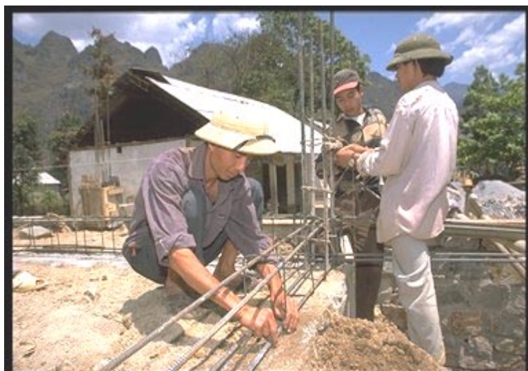
Proyecto de Desarrollo de Ha Giang en favor de las Minorías Étnicas Trabajadores de la construcción construyen el centro de salud del distrito en Yen Minh

22. Impacto económico de la mejora de la infraestructura. En general, se ha conseguido el impacto previsto de los componentes de construcción de caminos, que se han centrado en los caminos que unen a las distintas comunas, cuya mejora tiene un gran rendimiento económico. Por lo que concierne a los sistemas de riego, la superficie cultivada y los rendimientos han aumentado en la medida prevista, observándose un gran incremento de la producción agrícola en Tuyen Quang. Las obras de construcción han reportado en Quang Binh un aumento significativo de los con la ayuda