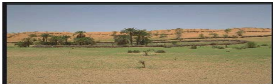
Mauritanie, Programme de redressement agricole II. Clôtures de protection des palmiers et ceintures de stabilisation des dunes (en arrière plan)

Région: Afrique de l’Ouest et du Centre (Afrique I) Pays: Mauritanie