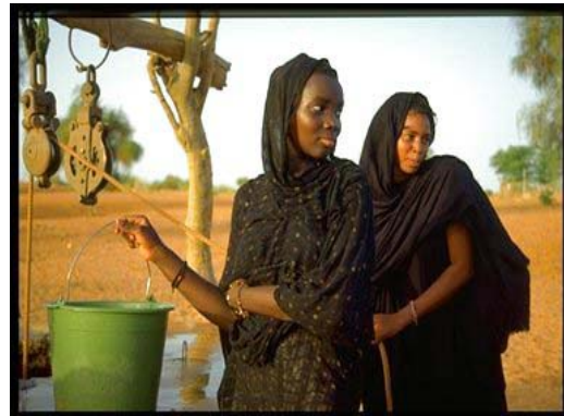
Mauritanie, Programme de redressement agricole. Femmes tirant de l’eau à un puits – Oasis d’Al Ajoua, région d’Assaba

Cofinanceurs potentiels: Des discussions sont en cours avec le Fonds arabe pour le développement économique et social (FADES). Le programme pourrait être admis à recevoir une aide du Fonds mondial pour l’environnement (FEM).