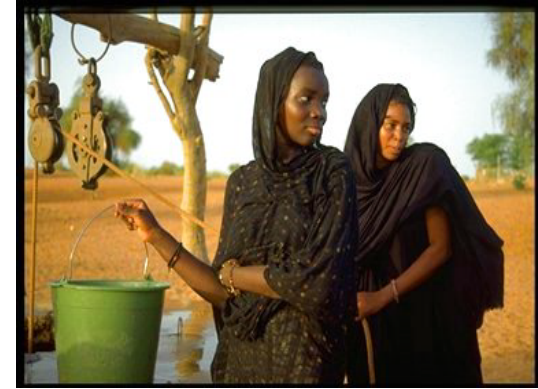
برنامج الإنعاش الزراعي - المرحلة الثانية. امرأتان تجلبان الماء من بئر في واحة الأوكجا، في إقليم آسابا.

للاتصال مع الصندوق الدولي للتنمية الزراعية السيد م. بيفوعي مدير شعبة أفريقيا الأولى السيد محمد بن سنية مدير الحافظة القطرية، الصندوق الدولي للتنمية الزراعية.