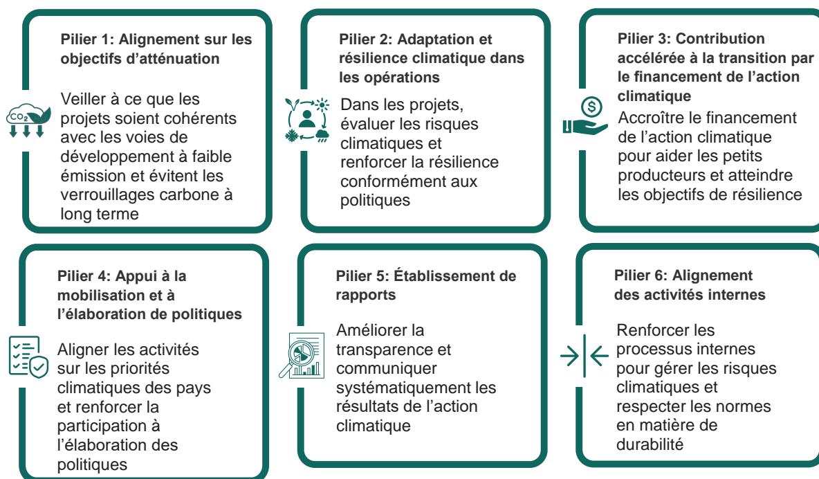
Figure 1 Piliers de l'alignement sur l'Accord de Paris