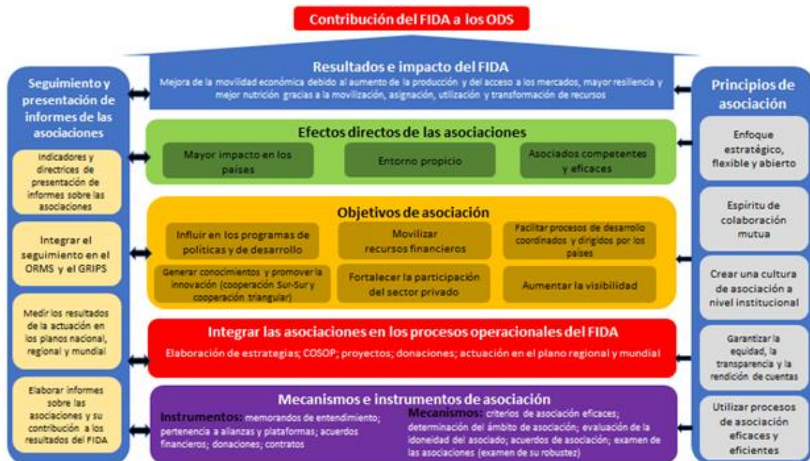
Marco de Asociación del FIDA