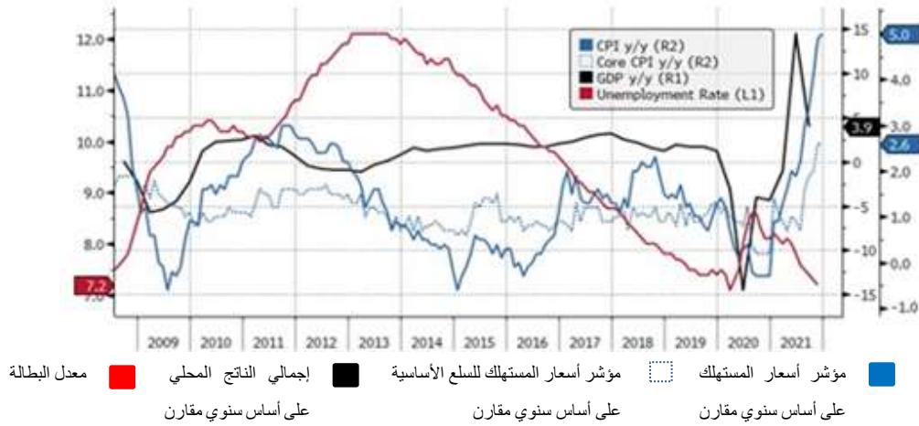
الشكل 2 مقاييس التضخم (أوروبا)