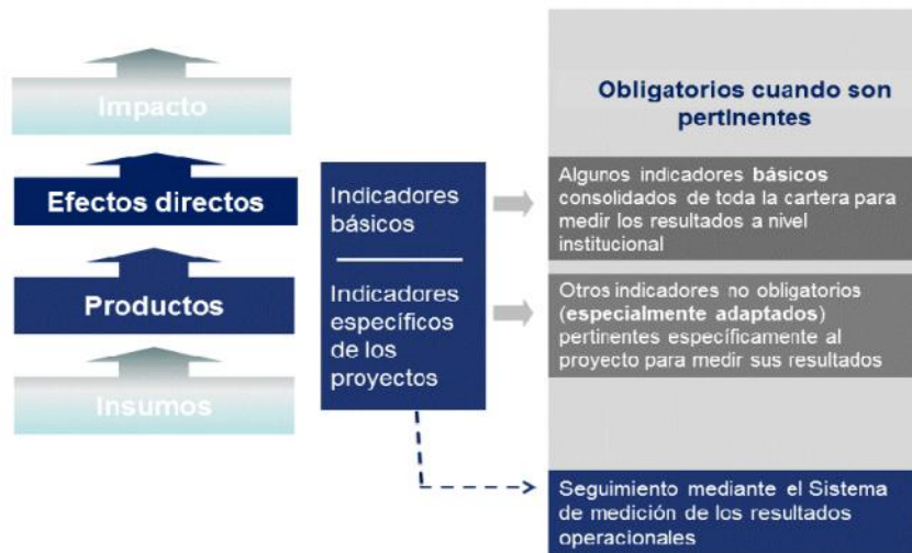
Figura 1 Indicadores básicos dentro de la cadena de resultados