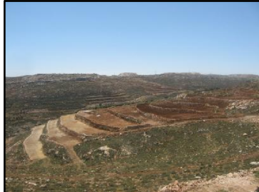
Beitonia, distrito de Ramallah, antes y después de la recuperación de las tierras