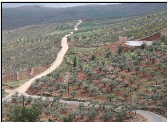
Aqraba, distrito de Nablus, construcción de caminos