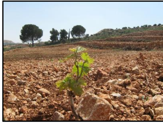
Deir Ammar, distrito de Ramallah, antes y después de la recuperación de las tierras