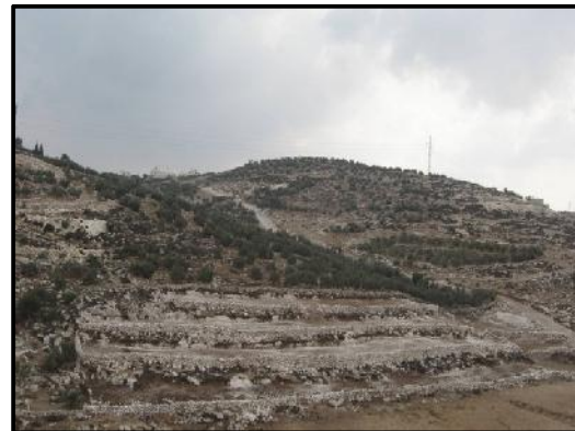
Alyamoun, distrito de Jenin, antes y después de la recuperación de las tierras y la rehabilitación de los caminos